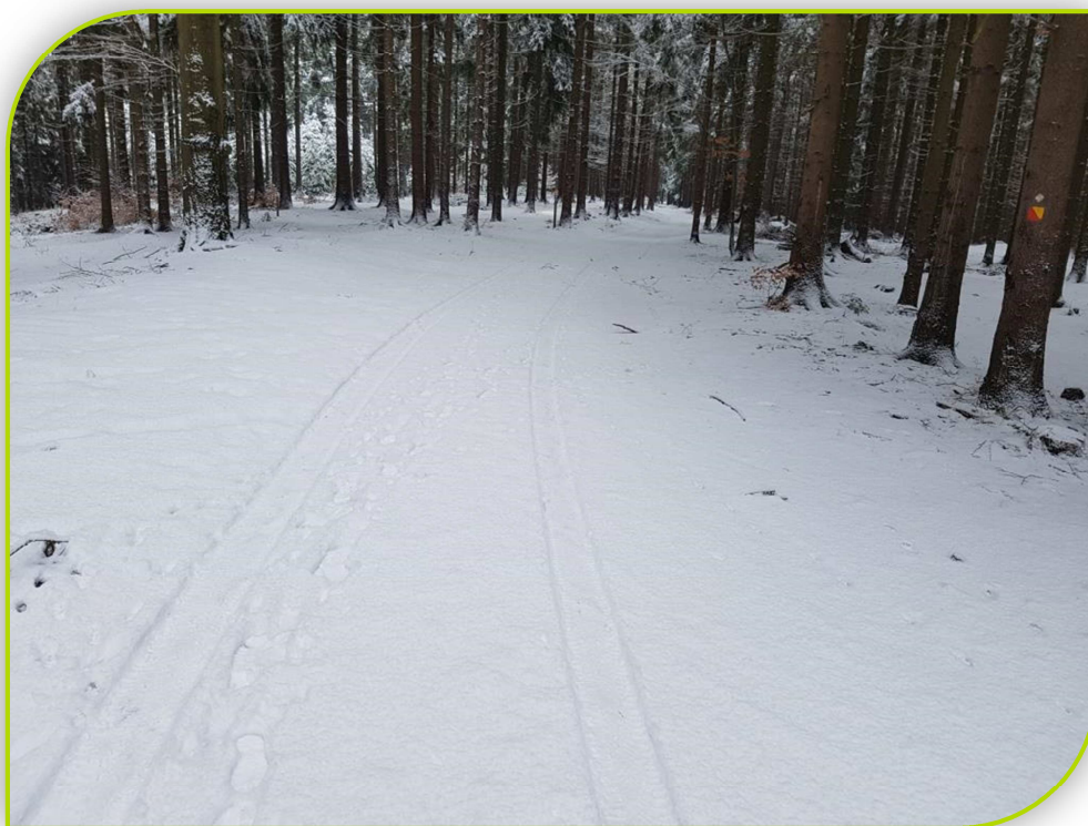
Pohled na stávající stav – ve směru staničení